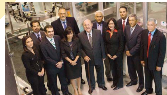
Ejecutivos de las industrias certificadas.